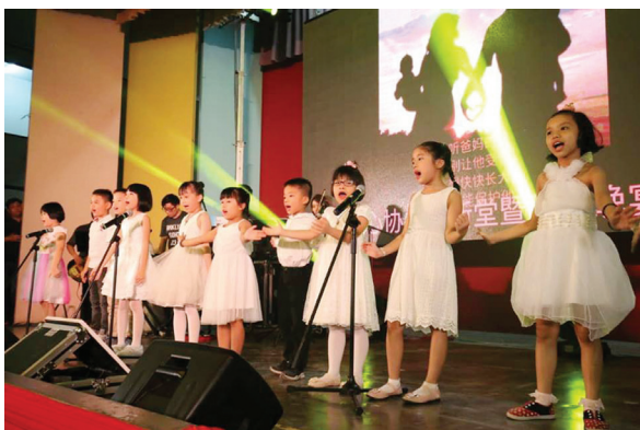
● 堂区要理班学生在晚宴中呈献歌唱表演。