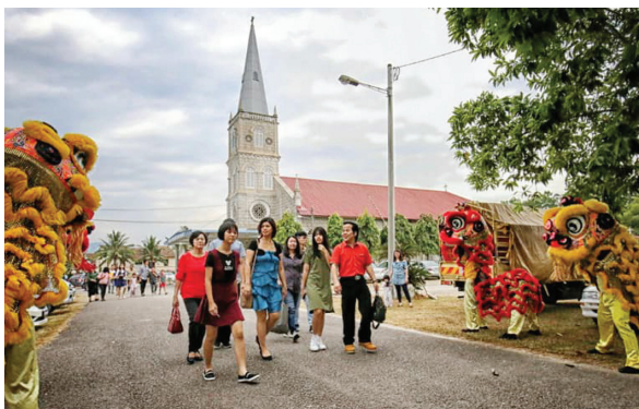
● 晚宴开场前，舞狮团热烈欢迎宾客的莅临。